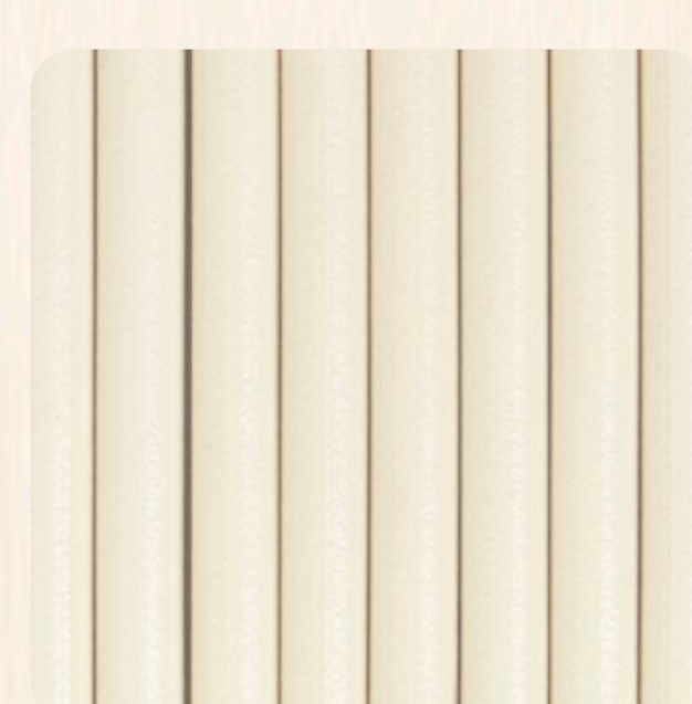
Beež (mänd, kuusk)