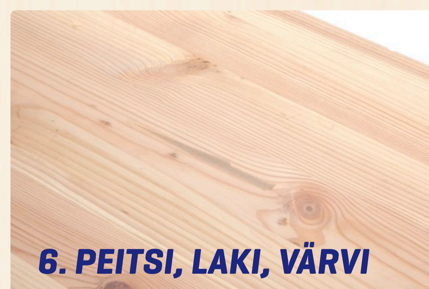
6. PEITSI, LAKI, VÄRVI